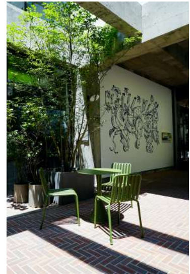
国道 50 号線と馬場川通りをつなぐバサージュに設置されたリアム・ギリックの作品。(右奥)